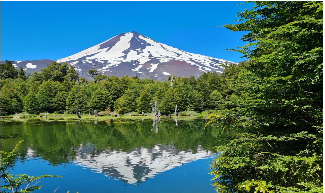
Llaima 3.125 m Conguillio Nationalpark

Seenplatte der Chilenischen Schweiz - Imposante, aktive Vulkane Conguillio Nationalpark – Traumhafte Araukarien-Urwälder